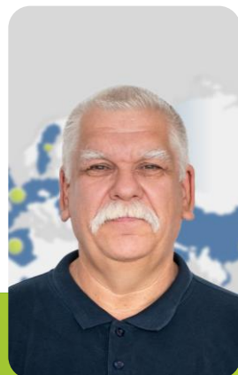
Ing. Ivan Balogh SERVIS